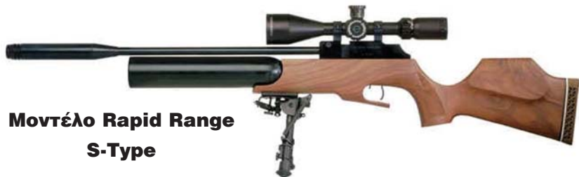
Μοντέλο Rapid Range S-Type