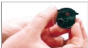
Γεμιστήρας 7 βολών