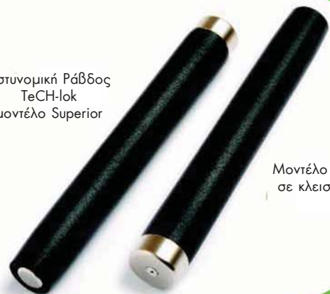
Μοντέλο STB21N σε κλειστή θέση