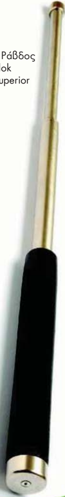
Αστυνομική Ράβδος TeCH-lok μοντέλο Superior