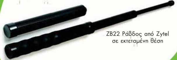
ZB22 Ράβδος από Zytel σε εκτεταμένη θέση